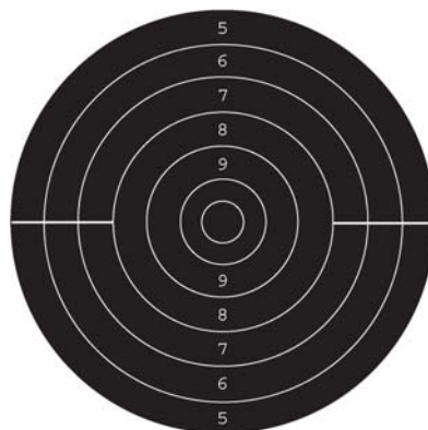
Fig.1 - blanco tiro rápido